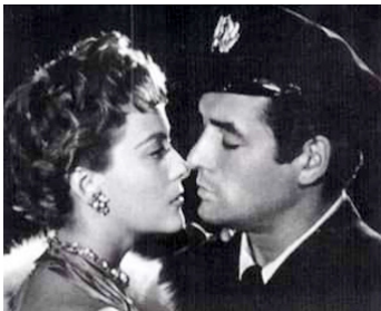
1957 CAP HORN (Cabo d'Hornos) de Tito Davison avec Silvia Pinal