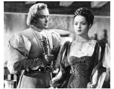
1948 POIGNARD ET TRAHISON (Lucura d'Amor) de Juan de Orduna avec Aurora Bautista