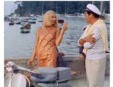
1958 FEMMES D'UN ÉTÉ (Racconti d'estate) de Camillo Mastrocinque avec Nadia Gray