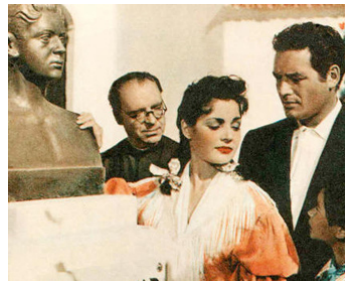
1954 LE CAVALIER ANDALOU (Un Caballero andaluz) de Luis Lucia avec Carmen Sevilla