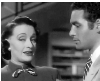
1952 JE VEUX VIVRE (Quiero vivir) d'Alberto Gout avec Andrea Palma