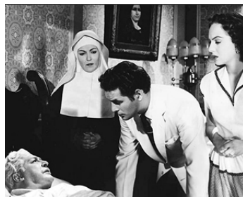
1952 LE DROIT DE NAÎTRE (El Derecho de nacer) de Z. Urquiza avec Gloria Marin, Martha Roth