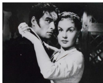
1953 LES HAUTS DE HURLEVENT (Abismos de pasion) de Luis Buñuel avec Lilia Prado