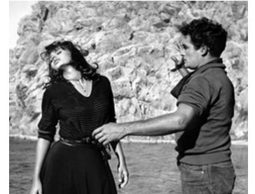
1957 OMBRES SUR LA MER (Boy on a Dolphin) de Jean Negulesco avec Sophia Loren