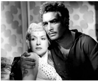
1954 LE TESTAMENT DE MONTE-CRISTO de Leon Klimovsky avec Elina Colomer