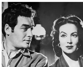
1953 PASSION SAUVAGE (Camelia) de Roberto Gavaldon avec Maria Felix