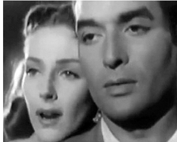
1950 PAUVRE CŒUR (Pobre Corazon) de José Diaz Morales avec Lilia Prado