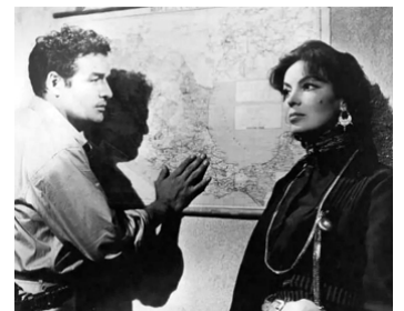
1960 LA GRANDE RÉVOLTE (Juana Gallo) de Miguel Zacarias avec Maria Felix