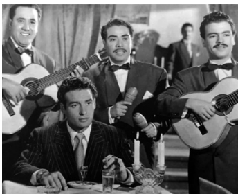
1952 LA NUIT EST À NOUS (La Noche es nuestra) de Fernando A. Rivero avec Los Tres Diamantes