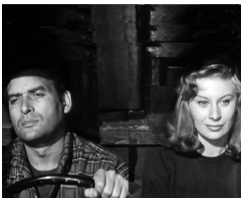
1958 LA LOI DE L'HOMME (È arrivata la Parigina) de Camillo Mastrocinque avec Magali Noël