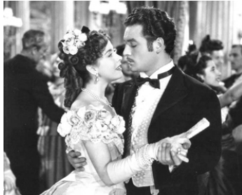
1949 BAGATELLES (Pequeñeces) de Juan de Orduña avec Sara Montiel