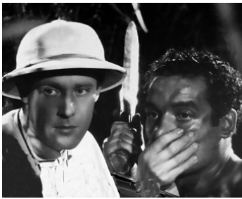
1946 LA MISSION BLANCHE (Misión blanca) de Juan de Orduña avec Fernando Rey