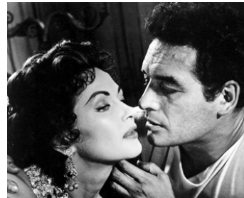
1958 L'ÉPÉE ET LA CROIX (La Spada e la Croce) de Carlo L. Bragaglia avec Yvonne De Carlo