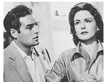
1952 LA MENTIRA (La Mentira) de Juan José Ortega avec Marga Lopez