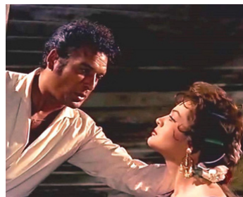
1959 CARMEN DE GRENADE (Carmen la de Ronda) de Tullio Demicheli avec Sara Montiel