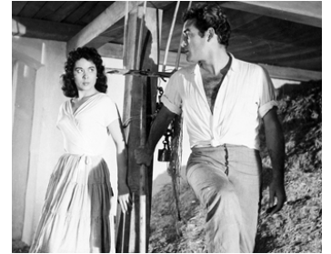
1956 LA CHATTE SAUVAGE (La Gata) de Rafael Maria Torrecilla avec Aurora Bautista