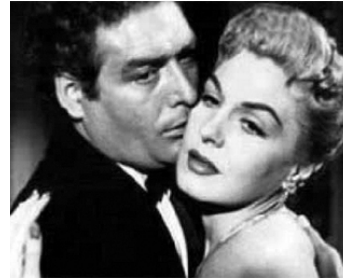
1955 AMOUR INTERDIT (Amor prohibido) de Luis César Amadori avec Zully Moreno