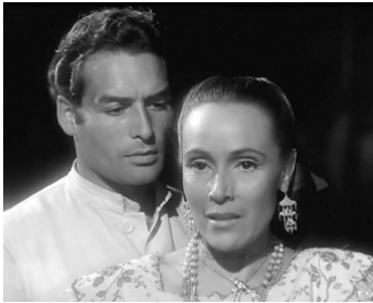
1950 LA DÉSIRÉE (Deseada) de Roberto Gavaldon avec Dolores Del Rio