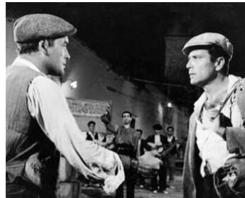
1957 VENGEANCE (La Venganza) de Juan Antonio Bardem avec Raf Vallone