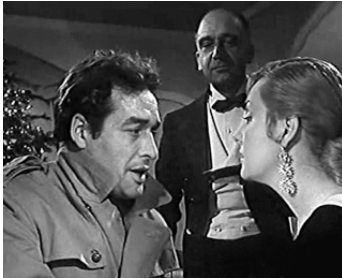
1956 LA LÉGION DU SILENCE (La Legion del Silencio) de J. M. Forqué avec Nani Fernandez