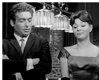
1962 HISTOIRE D'UNE NUIT (Historia de una noche) de Luis Saslavsky avec Paquita Rico