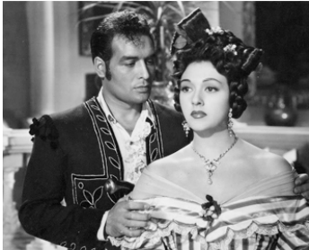
1949 LA DUCHESSE DE BENAMEJI (La Duquesa de Benameji) de Luis Lucia avec Amparo Rivelles