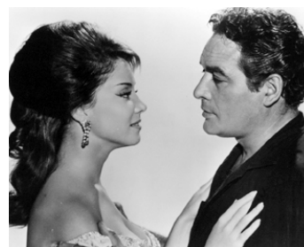
1963 GUNFIGHTERS OF CASA GRANDE de Roy Rowland avec Paquita Rico